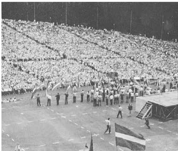
150 000 cilvēku lielā sanāksme 1988. gada 7. oktobrī Mežaparkā Latvijas Tautas frontes dibināšanas kongresā. Latvieši un citu tautību cilvēki prasīja, lai Padomju Savienības vadība dod Latvijai saimniecisko pašnoteikšanos.

Tās rūpnīcas, kuras spējušas izdzīvot un attīstīties, kā arī ražotnes, kas šeit sāka strādāt jau neatkarīgajā Latvijā, ir un būs galvenais mūsu pilsētas balsts. Tāpēc Olaines nākotne man izskatās visai cerīga.